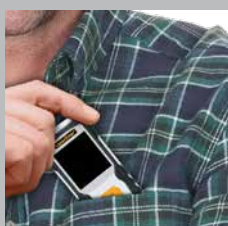
Kleine, compacte bouwvorm